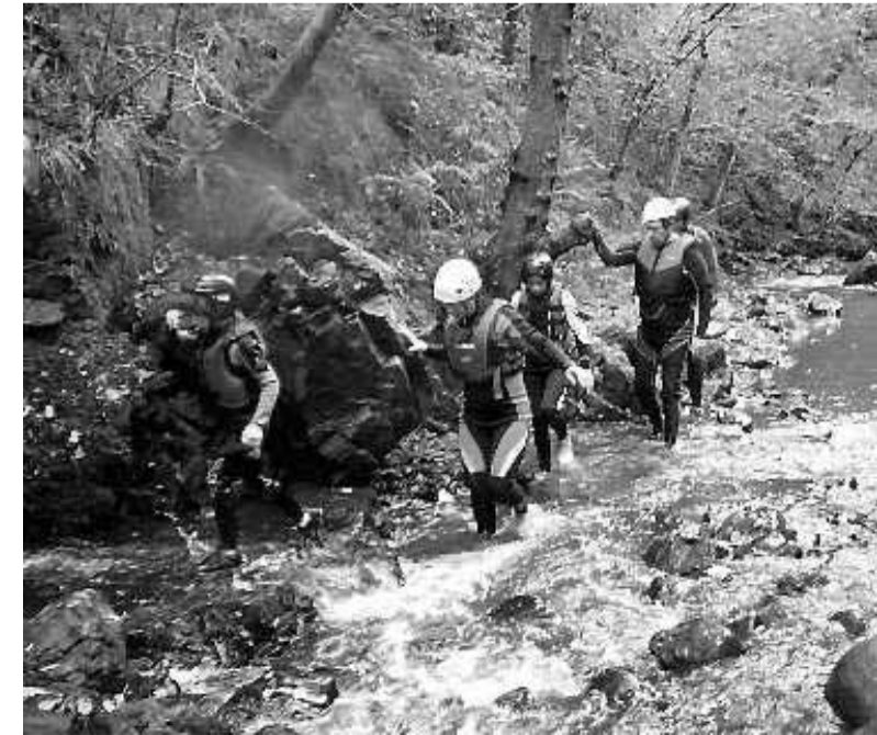
• Gorge Walking is een geweldige ervaring, maar het water is ijskoud.

Enigszins opgewarmd vertrekken we naar de Penderyn Whisky