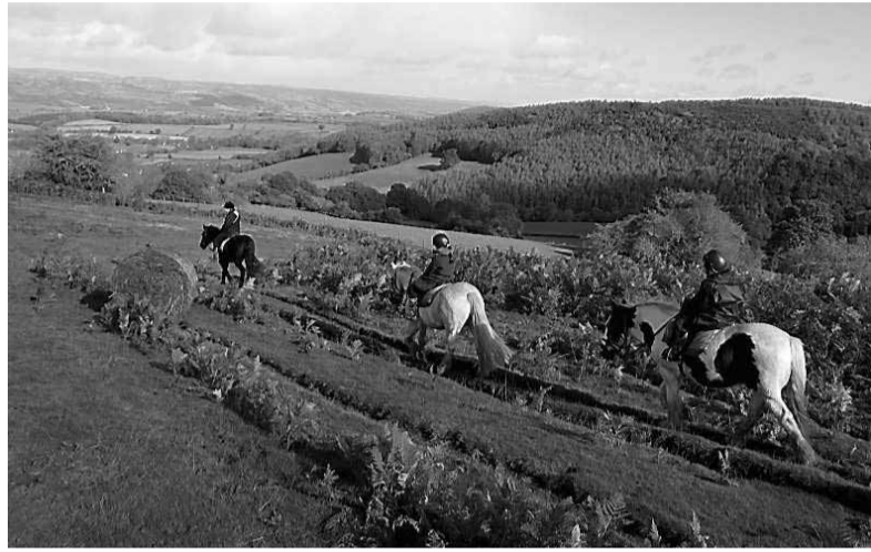
• De paden op de lanen in Ponryjden in de prachtige natuur is een belevenis. • Boeken, boeken en nog eens boeken in Hay-on-Wye.

graag naar Park Guell, willen, dat ontworpen is door Gaudi. Voor de kinderen is er ook genoeg te doen. Zo willen we zeker naar de dieren-tuin van Barcelona; die schijnt heel mooi te zijn. En een beetje rondtoeren in de auto, richting de Pyreneeën. Je komt dan door allemaal kleine dorpjes waar je een beetje kunt rondkijken en een terrasje kunt pakken. Wij vinden Spanje geweldig, overall is wel iets te zien of te doen. En eigenlijk is het altijd lekker weer.“ Kosten: 250 euro totaal