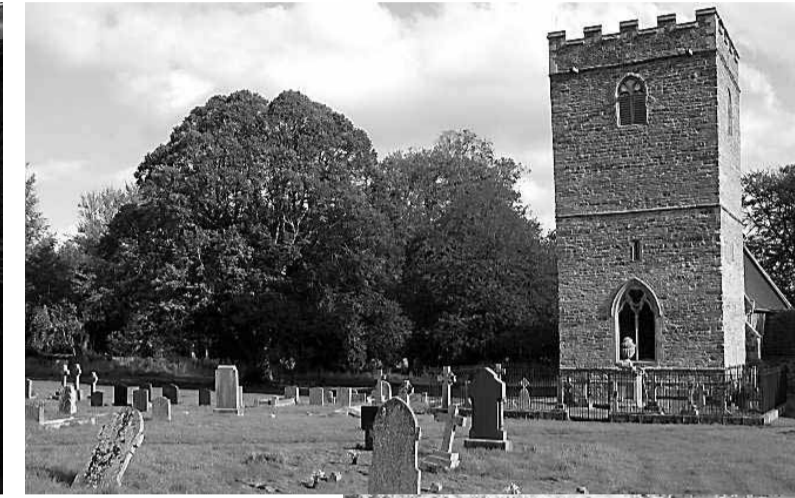
• Het karakteristieke kerkhof van Llanfrynach.